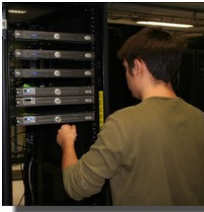
Mezcalito est propriétaire de ses serveurs hébergés à Grenoble